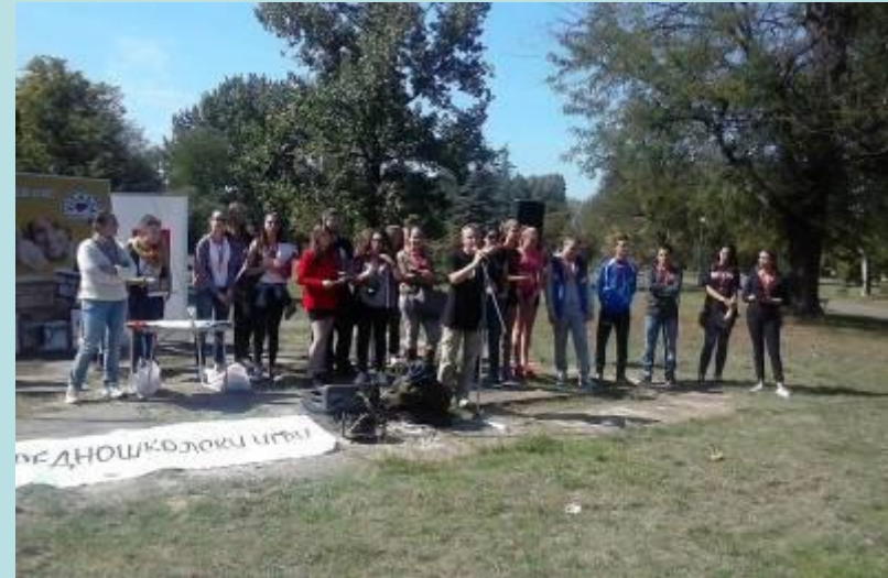
Натпревар за Прва помош